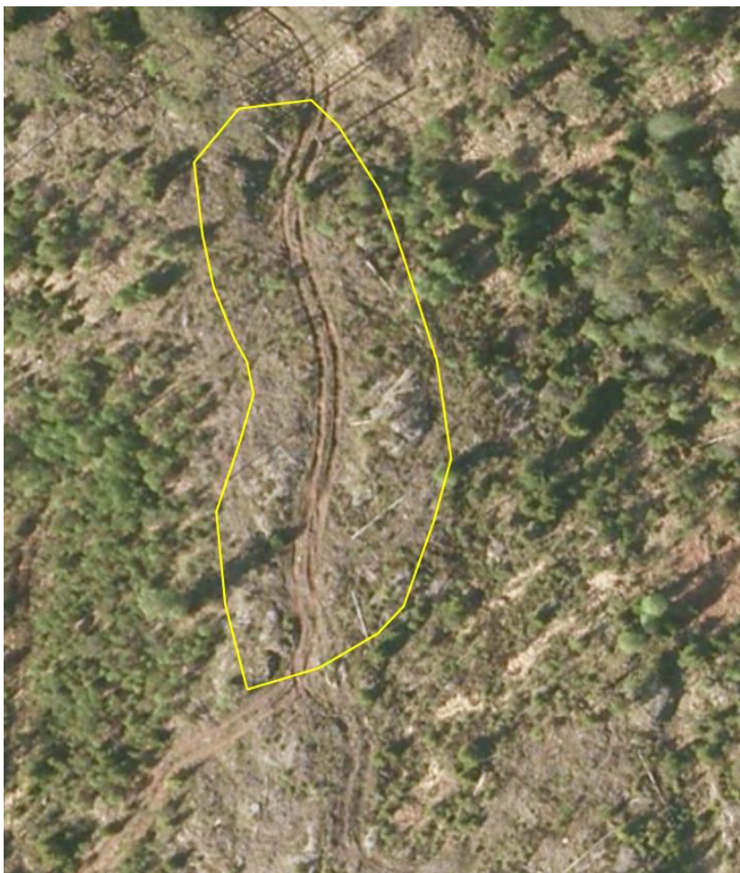
Figur 2. Digitalt temalag med nøkkelbiotoper lagt oppå detaljerte flybilder gir et godt grunnlag for vurdering av tilstanden. Dette er et særdeles stygt eksempel. De fleste skadene har mindre omfang enn her.

Prosjektet har dratt ut i tid og flybildene som ble benyttet ved gjennomgangen i Del 2 var for deler av undersøkelsesområdet ikke de samme som i Del 1. For Marker kommune ble imidlertid kontrollene i Del 1 og 2 basert på de samme flybildene – fotografert i perioden juni – august 2010 og oppløsningen var 0,5 m. For Aremark kommune ble kontrollen i Del 1 basert på flybilder tatt i perioden juni – august 2010 med en oppløsning på 0,5 m, mens kontrollen i Del 2 ble basert på flybilder tatt den 8. mai 2011 med en oppløsning på 0,2 m.