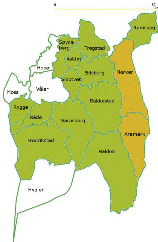
Figur 1. Østfold fylke med de kontrollerte kommunene i grønt, de grundigere kontrollerte i gult og de ikke-kontrollerte i hvitt.

Del to av prosjektet var en grundig gjennomgang av samtlige nøkkelbiotoper i skog i to kommuner (Aremark og Marker) hvor resultatet av gjennomgangen ble dobbeltsjekket samt at mulige feilkilder både i tilsendt materiale samt i metodikk ble minimalisert så langt det var praktisk mulig uten supplerende feltundersøkelser.