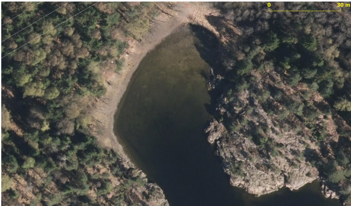
8 – Halvsundbukta