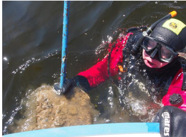
Figur 2. Et stykke av sjøbunnen ble skåret ut med kniv og levert om bord i båten på en skyffel.

På én av disse (nr. 7) har det tidligere blitt påvist vasskrans, i 2002 og trolig i 1969.