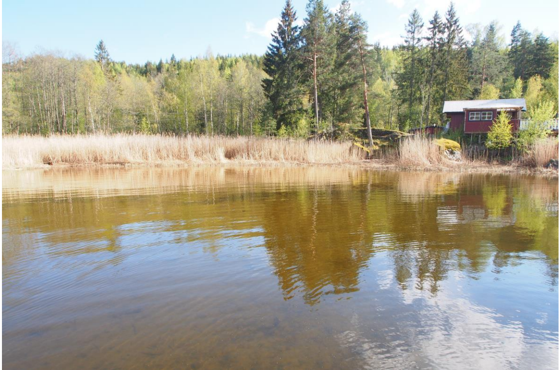
3 – Gårdembukta øst