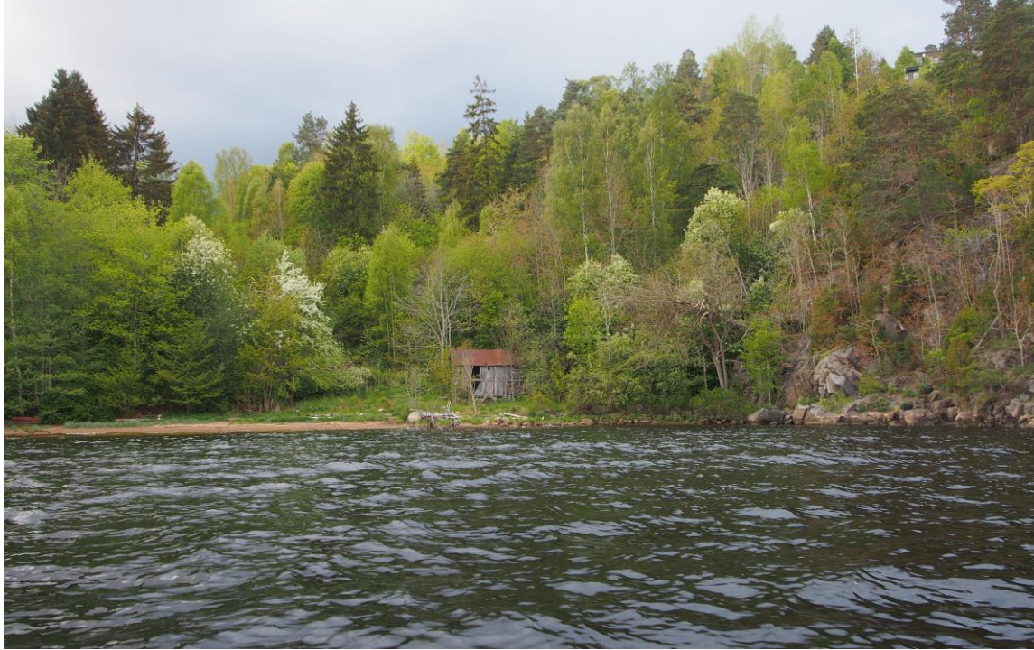
11 – Tjennedalsbukta