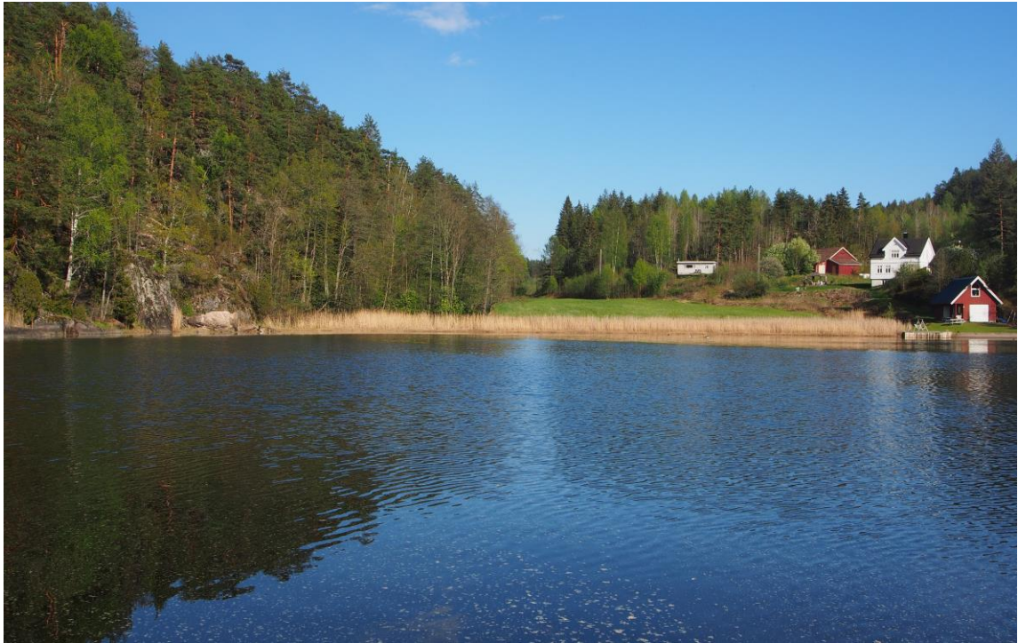
1 – Hytterød