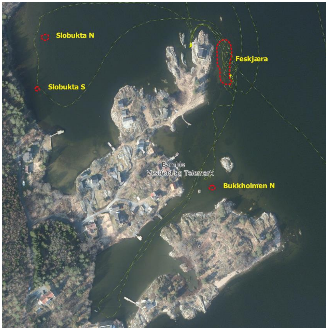
Figur 1. Funn av småvasskrans i den sørlige delen av kartleggingsområdet i 2020 (røde sirkler). Prikket gul linje er sporlogg fra 19. mai 2021.