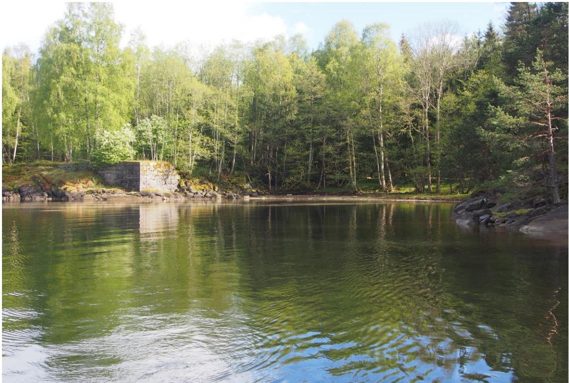
4 – Sibjørnbukta vest