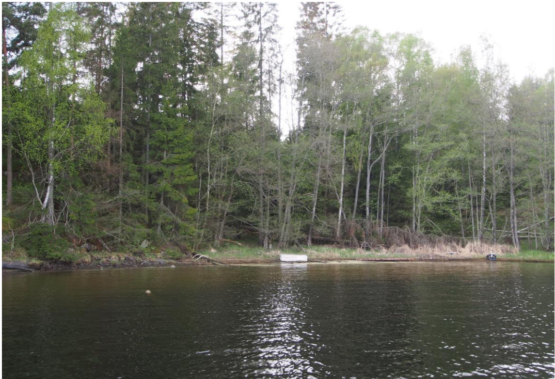
16 – Persbukta vest