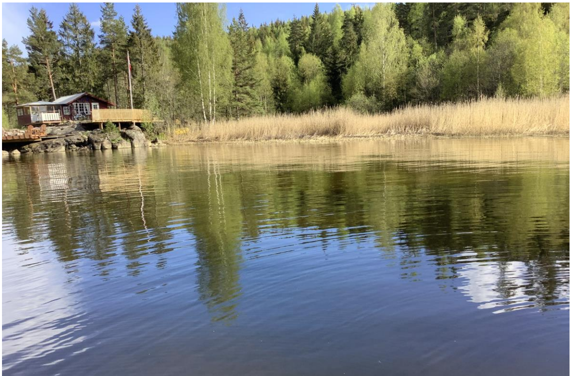
14 – Gårdembukta vest