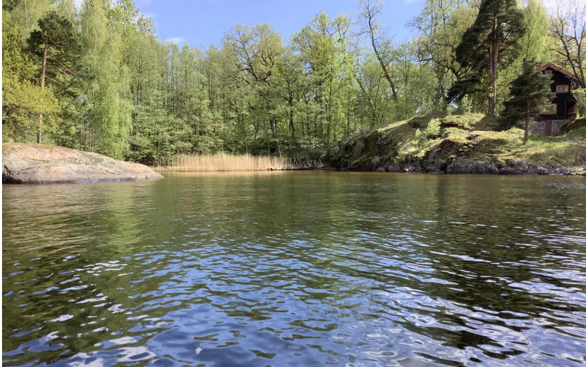
13 - Innenfor Måkeskjær