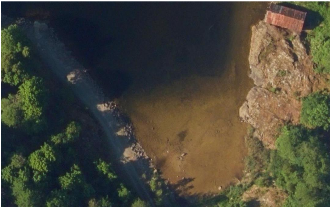
12 – Rafnesbukta