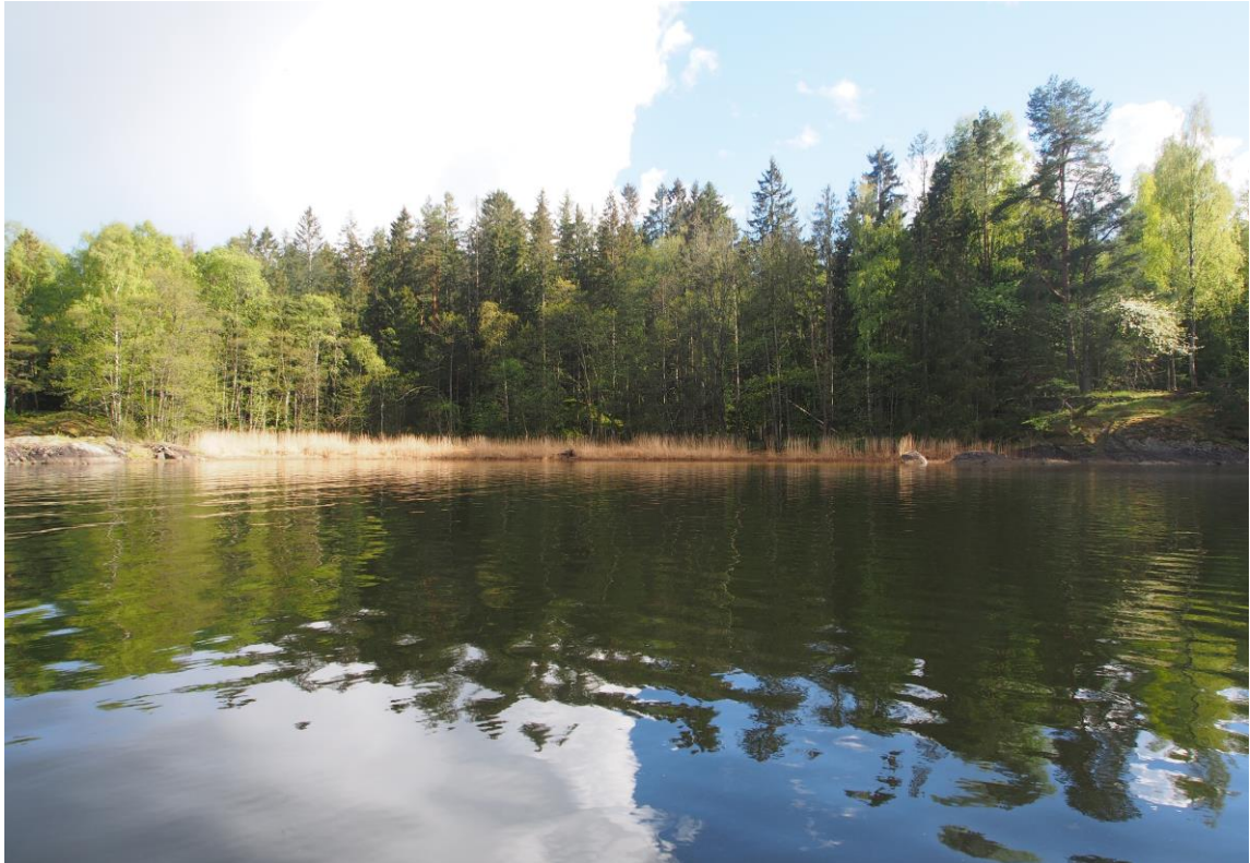
5 – Sibjørnbukta øst