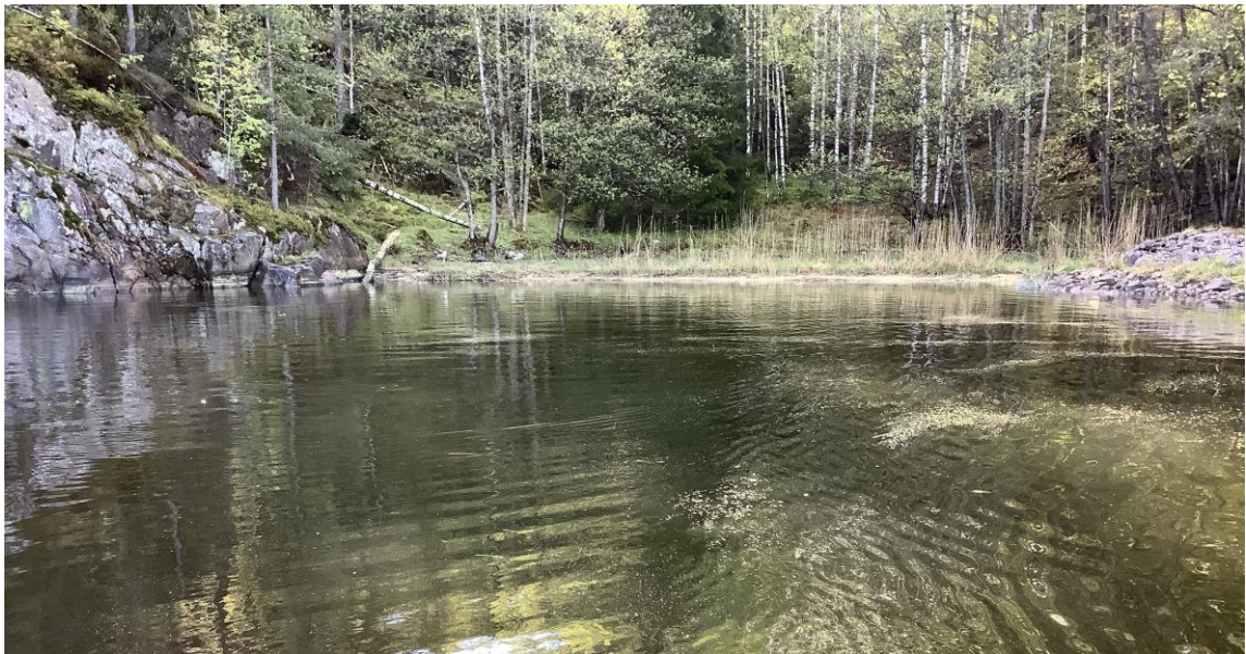
2 – Teinetangen