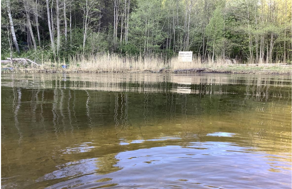
15 – Torskeholet