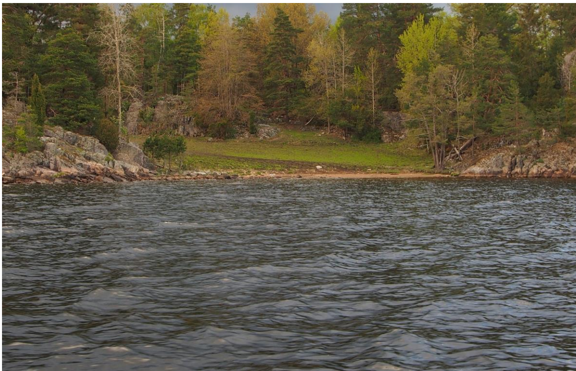
10 – Stranda-Flesketangen