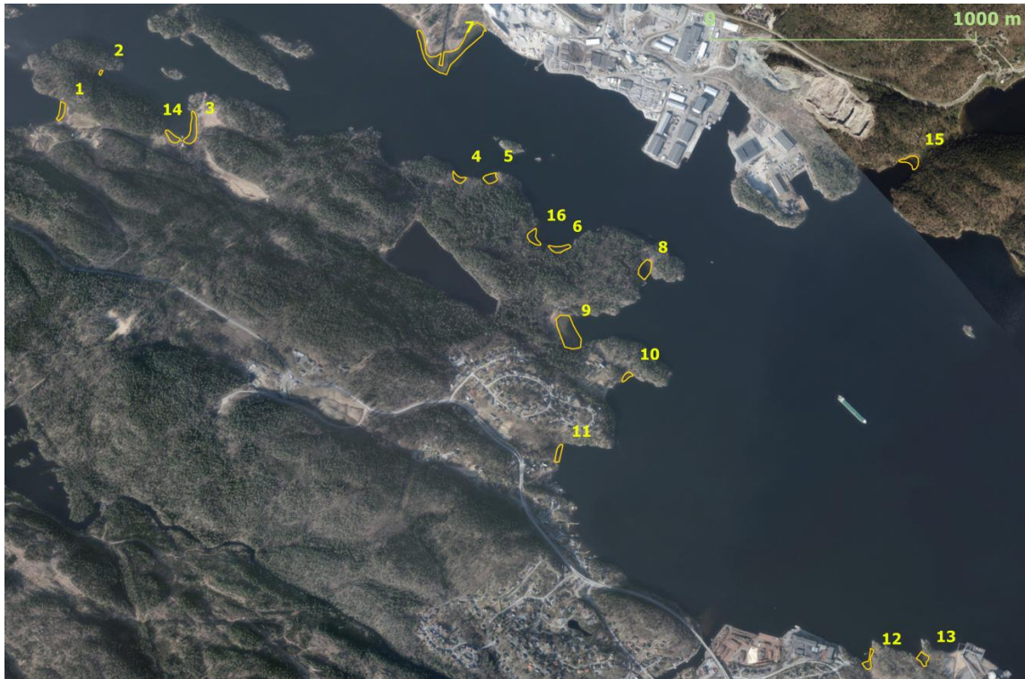
Figur 4. Kartet viser 16 potensielle tilflytningslokaliteter for småvasskrans. Vurderingen i felt førte til at 3 av disse regnes som spesielt godt egnede habitat for småvasskrans.