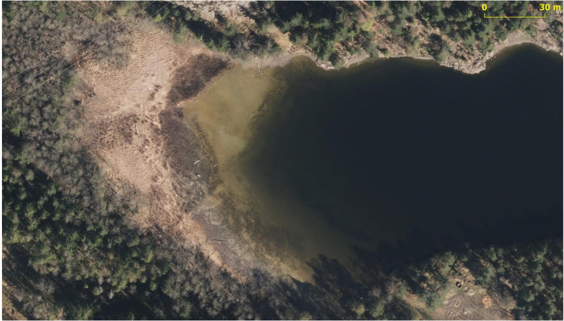
9 – Langekilen