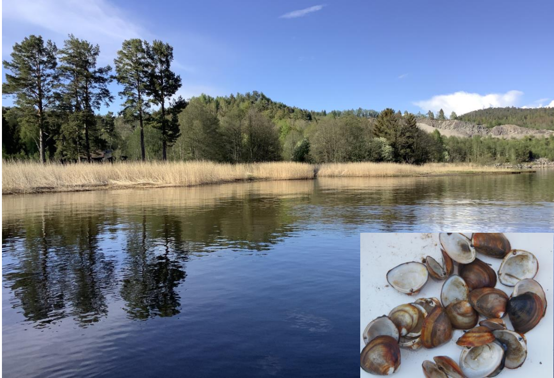
7 – Rørabekken. Innfelt bilde av fremmedarten Rangia cuneata som har en meget stor bestand på lokaliteten.