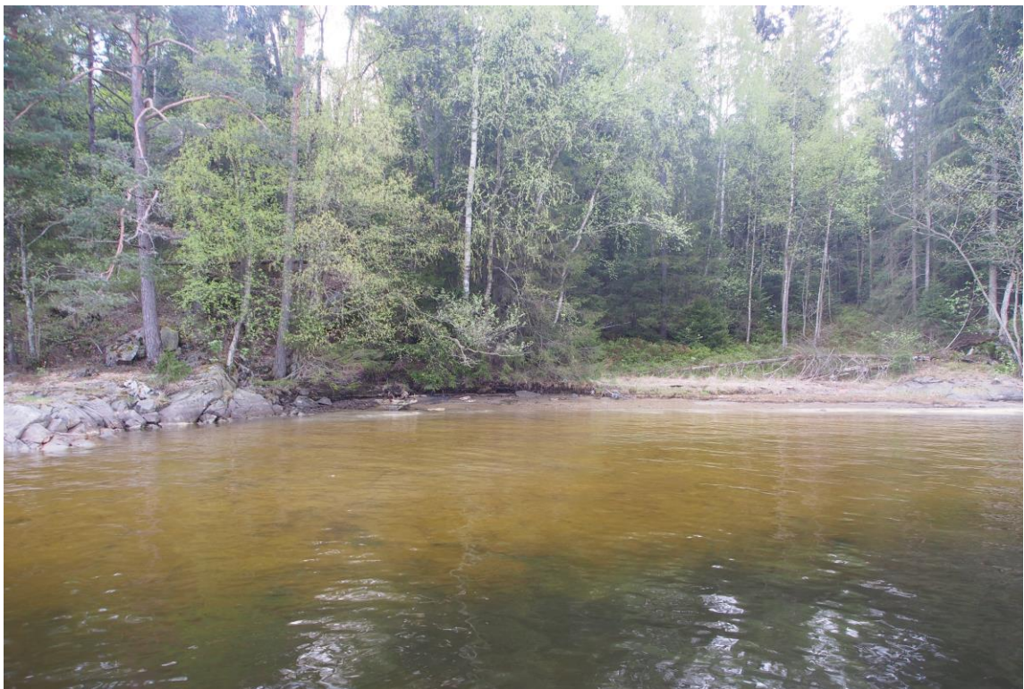
6 – Persbukta øst