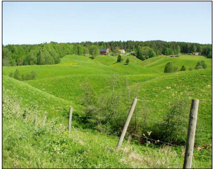
Fig. 4. Rikt og variert kulturlandskap, sett inn et bilde fra et pent kulturlandskap i Våler her

Områder der dagens kulturmarkstype eller arealtype og artsutvalg er betinget av tidligere og nåværende arealbruk og driftsformer. Mange naturtyper som var vanlige før har gått kraftig tilbake. Disse naturtypene er ofte artsrike miljøer med mange spesialiserte arter som er avhengig av kulturpåvirkning. De enkelte naturtypene presenteres nærmere nedenfor.