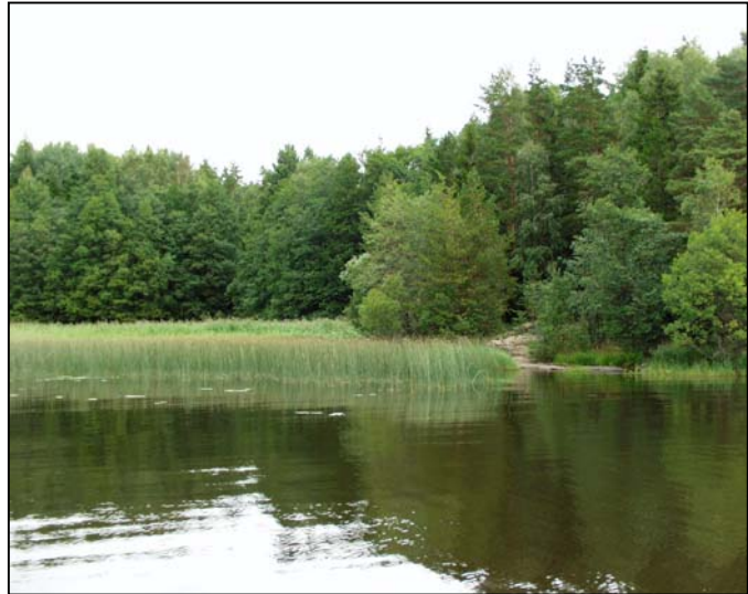
Fig. 6. Vansjø er et eldorado for planter, dyr og mennesker, men den må tas vare på om den skal fortsette å være det. Forurensing og motorferdsel er i dag alvorlige trusler mot innsjøens kvaliteter.

Alle naturtyper som betinges av åpent ferskvann. Norge har en uvanlig stor tetthet av ulike ferskvannstyper, og disse er utbredt over hele landet. Ferskvannsnaturen har en viktig økologisk funksjon som påvirker mange naturtyper ellers. Selv om norske vann og vassdrag generelt er karakterisert som ione- og næringsfattige, har vi en lang rekke av spesialiserte arter, hvor mange av disse er truede. Viktige naturtyper i ferskvann er i hovedsak koblet mot grad av urørthet, økologisk funksjon, sjeldenhet og artsrikdom. Arealene med våtmark har gått kraftig tilbake, og fortsatt blir våtmark utfylt og drenert på bekostning av det økologiske samspillet og artsmangfoldet i naturen.