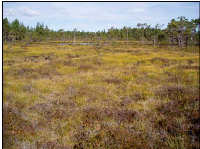
Fig. 3. Sett inn et bilde av ei myr fra Våler her. Helst burde det være et bilde av Langemyr med fylkets eneste forekomst av rankstarr.