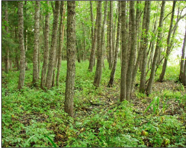
Fig. 7. Eksempel på en stor svartorsumpskog på Lostangen på Texnes.

For å bevare disse artene må vi ha et variert skogbruk med et system av nøkkelbiotoper og evighetstrær, samt ivareta generelle flerbrukshensyn. I tillegg kommer naturreservater og barskogsverneområder som er opprettet over hele landet, hvor det ikke skal foretas noen som helst inngrep. Kartlagte naturtyper under denne hovednaturtypen i Våler er: Rik edelløvsog - 1, Gammel edelløvsog - 1, Gråor-heggeskog - 2, Rikere sumpskog - 15, Urskog/gammelskog - 30, Bekkekløfter - 4, Store gamle trær - 6, Andre viktige forekomster - 4.