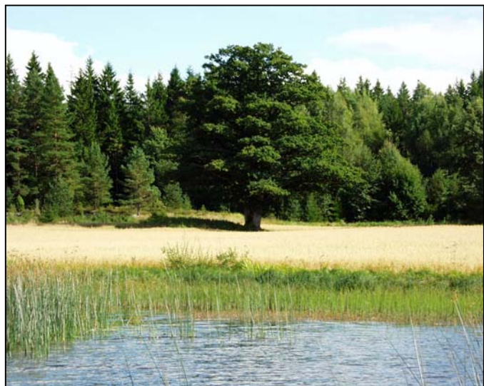
Fig. 5. Store gamle trær er viktige for mange spesialiserte arter. En monumental eik på et jorde er et estetisk landskapselement. Her ei eik ved Vansjø.

Store og gamle frittstående løvtrær i kulturlandskapet, kan være svært artsrike og representerer lang kontinuitet. De er viktige habitat for sjeldne og rødlistede arter av både lav, sopp, mose og insekter. Inntil trærne er det ofte en smal randzone der mange eng- og kantsonearter har mulighet til å overleve, noe som også gir verdifulle tilskudd til artsmangfoldet. De største truslene mot store trær er nedhogging og utskygging da store løvtrær er spesielt lyselskende. I kommunens database er det registrert 18 forekomster av store gamle trær, her er det også registrert noen store trær i skog som gran, furu og lerk, selv om disse egentlig ikke faller inn under denne definisjonen, de har imidlertid også gjerne stor verdi for artsmangfoldet og kan derfor med fordel beholdes, men det bør vurderes om de bør sortere under kategorien "Andre viktige forekomster". Naturtypen står oppført som truet i Stortingsmelding nr. 8 / 1999-2000.