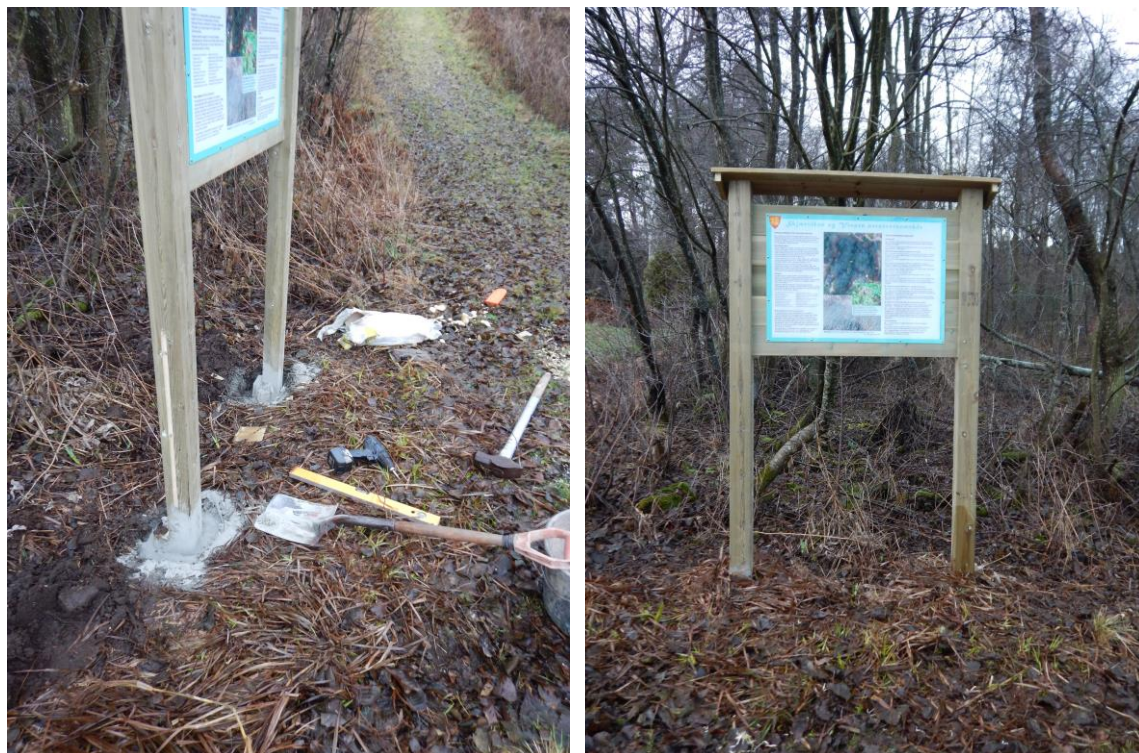
Fig. 3. Informasjonstavlen ble festet til peler som var slått ned til 1,3 m dybde og hullet i bakken, med skjøten, ble fylt med betong.