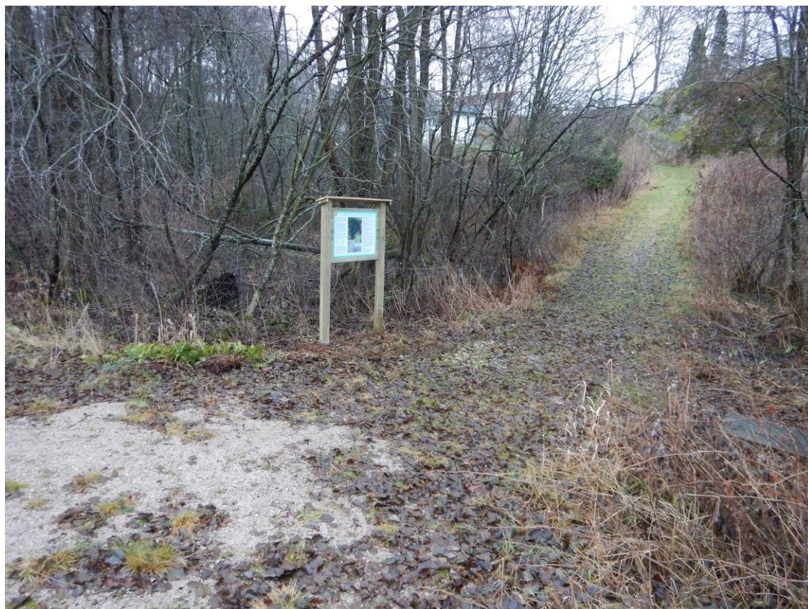
Fig. 4. Informasjonstavlen ble plassert ved bekken helt sør i naturvernområdet, i «krysset» der stien fra sjøen møter stien ned fra parkeringen oppe ved Tingstedveien.