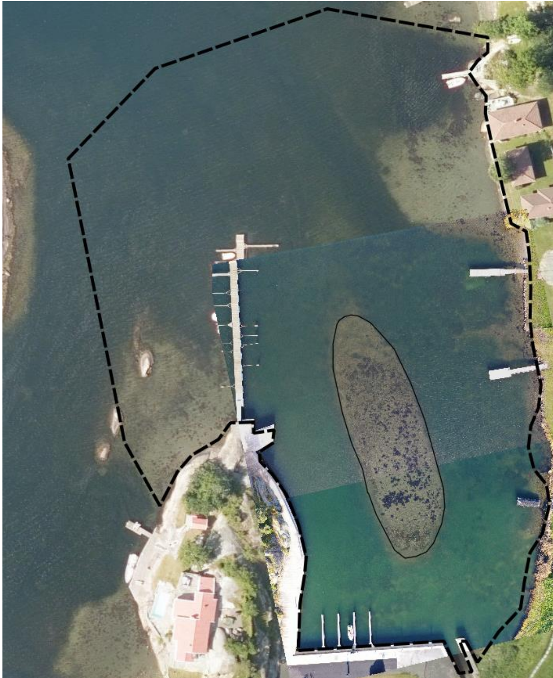
Figur 2. Flybilde fra Berganodden med bukta innenfor tatt 30. juni 2017, mens bildet av selve bukta er et georeferert dronebilde tatt 23. oktober 2019. Tjukk stiplet svart strek er avgrensning av plan- og influensområdet. Tynn svart strek angir den «pallen» med mudder som planlegges fjernet.

Planområdet i sjø omfatter den lille grunne bukta innenfor Berganodden på vestsiden av Østerøya i Sandefjord kommune. Influensområdet, som her er lagt inn i planområdet, omfatter hele bukta samt en del av gruntvannsområdet på nord- og vestsiden av innløpet til bukta.