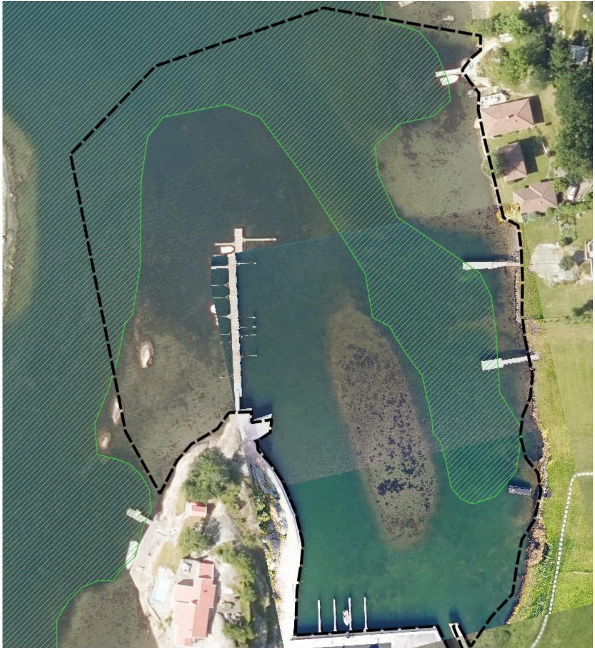
Figur 6. Avgrensning av ålegrasenga ved Berganodden, basert på feltarbeid utført den 23. oktober 2019.