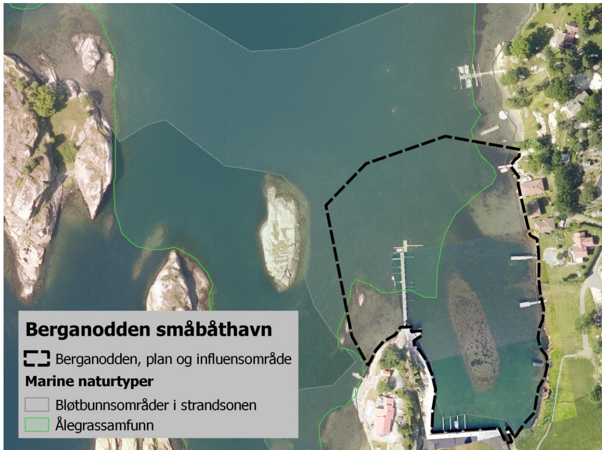
Figur 4. Kjente naturtyper i planområdet, slik de er registrert i Naturbase i 2009. Ålegrassamfunnet er vurdert som Svært viktig (A) og Bløtbunnsområdet som Viktig (B).

Den kjente forekomsten av Naturtypen Ålegrasenger og andre undervannsenger er revidert når det gjelder beskrivelsen og avgrensning på grunnlag av feltarbeidet og er beskrevet under Nye registreringer nedenfor.