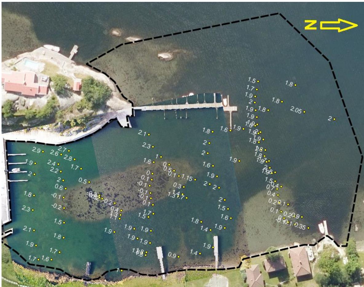
Figur 5. Dybdekart for området der tiltaket er planlagt. Dybdene er målt med ekkolodd på høyvann og justert til sjøkartnull . Som det går fram av justerte dybder, vil pallen ved ekstra lavt lavvann, stikke ca. 0,3 m over vannflaten. Merk at dybdepunktene er tatt med håndholdt GPS slik at geografisk nøyaktighet av punktet er ca. 3 m.

Dybderegistreringer ble målt med ekkolodd og målingene ble justert til sjøkartnull (1996-2014) i henhold til tidevannstabellen på det aktuelle tidspunktet. Dybdekartet er gjengitt i figur 5 nedenfor.