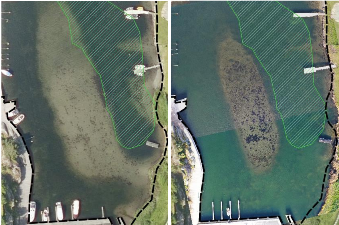
Figur 7. Til venstre vises utbredelsen av ålegrasenga i 2019, lagt på ortofoto fra 2017. Til høyre vises utbredelsen av ålegrasenga lagt på et georeferert dronebilde, tatt samme dag som kartleggingen ble foretatt (23.10.2019). Det framgår av figurene at ålegrasenga nå vokser på områder som ble fjernet ved mudringen i 2017.

Ålegras Zostera marina var den vanligste arten i undervannsenga i småbåthavna, men det var også iblandet en god bestand av småhavgras Ruppia maritima . Denne arten var relativt vanligere enn ålegraset på de grunneste områdene i undervannsenga.