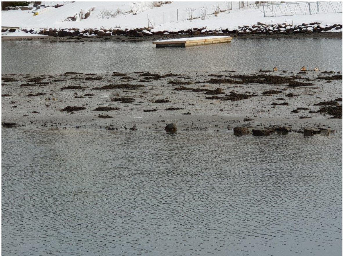
Figur 3. Ved spesielt lavt tidevann ligger toppen av «pallen» over vann.

Tidligere mudringstiltak har medført at det i dag står igjen en «pall» med mudder sentralt plassert i bukta (se figur 2). Dybden omkring er på ca 2 m, mens toppen av selve «pallen», ved spesielt lavt vann, blir liggende over vannflata (figur 3). Tiltaket består i å fjerne denne «pallen», slik at dybden i hele bukta blir på ca 2 m. Arealet av «pallen» som ønskes fjernet, er på ca. 1,4 daa, og muddermengden som da ønskes fjernet vil være i størrelsesorden ca. 3000 pfm 3 (prosjekterte faste kubikkmeter).