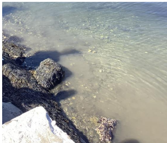
Figur 5. Bunnforholdene ved badetrappa ved Sementen. Trappa var ikke satt ut for sesongen.

Vår konklusjonen blir her at utleggingen av sand som har skjedd, har, pga. liten mengde og tykkelse, samt påfølgende bølgevirksomhet, ikke medført noen påviselig negativ effekt på artsmangfoldet, hverken inne ved flytebrygga eller ved badetrappa.