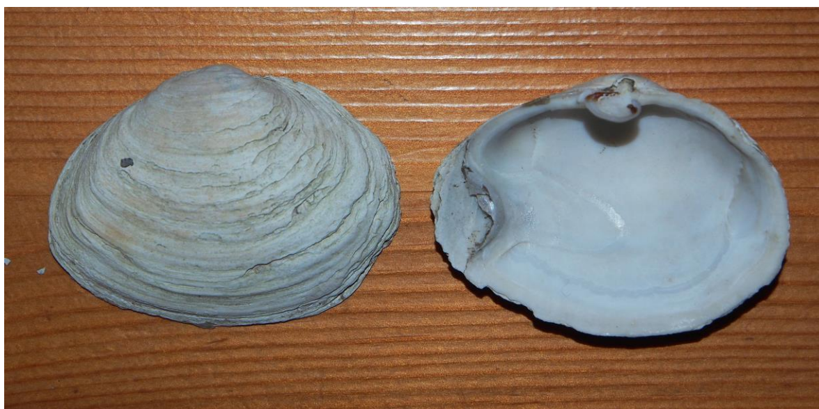
Figur 10. Det ble påvist flere skall av vanlig sandskjell med misdannelser og unormal fasong. Lokalkjente lurte på om dette kunne skyldes giftstoffer i sjøbunnen. Vi antar imidlertid helst at misdannelsene skyldes mekanisk skade etter graving eller tråkkskader.

Som på de andre to badeplassene ligger det meste av sanda også her over flomålet. Vi gjorde undersøkelser i hele vika og kunne ikke finne noen signifikante forskjeller i faunaen i vika der det er lagt ut sand, sammenlignet med områdene som ikke er tilført sand. Konklusjonen blir at utleggingen av sand heller ikke her har medført noen påviselig negativ effekt på det marine artsmangfoldet ved denne badeplassen.