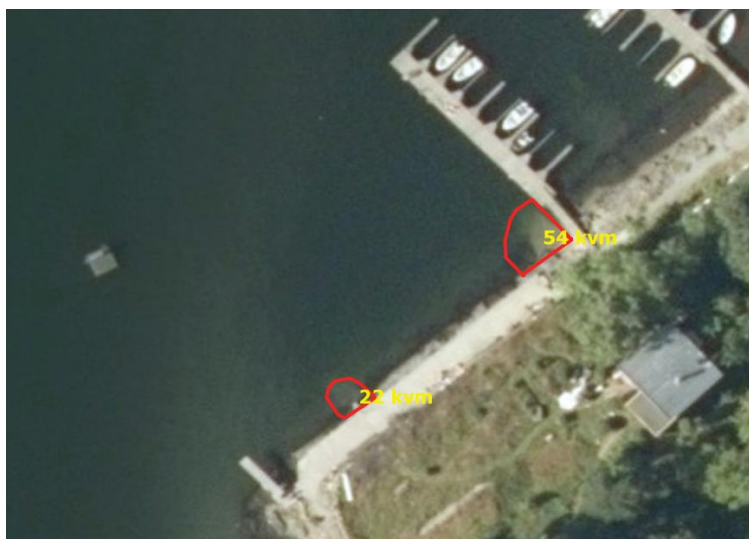
Figur 3. Badeplassen Sementen (Gnr/bnr 41/176) ligger ytterst i bukta Pilbogen. Det er lagt ut sand innerst i hjørnet mot flytebrygga, samt under badetrappa lenger ut mot stupebrettet (rød strek).

Følgende arter ble notert der det var lagt ut sand: Spiraltang