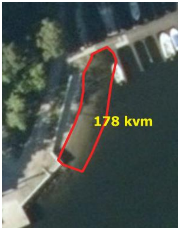
Figur 6. Badeplassen Søndre brygge (Gnr/bnr 41/173) ligger rett nord for brygga der Langårsundet er på det smaleste.

Spiraltang, blæretang, stillehavsøsters (SE) (ikke tallrik), blåskjell, nettsnegl, storstrandsnegl, saueskjell, teppeskjell Venerupis corrugata , leddsnegl (Polyplacophora), fjæremark Arenicola marina (sparsomt). Steinene i fjæra var tilvokst med kalkrørsormer og fjærerur. Vi fant ikke levende sandskjell Mya arenaria (NT), men en del skall ble påvist.