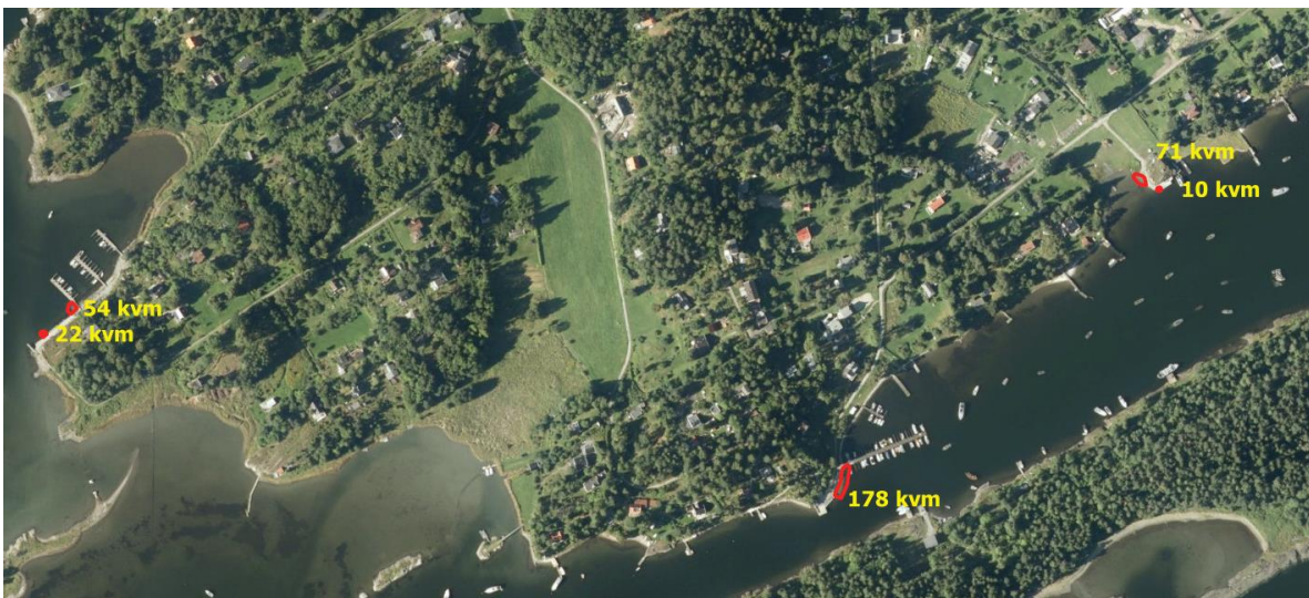
Figur 2. De tre badeplassene ligger på sørsiden av Brønnøya. Fra venstre ligger Sementen, Søndre brygge og Storeslott.