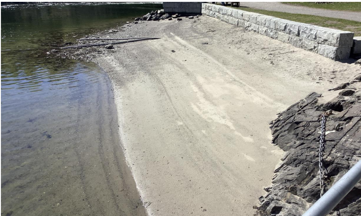
Figur 7. Stranda ved søndre brygge fotografert fra nord. Her ligger det meste av sanda på land, og bare inn mot flytebrygga er det sand i sjøen.