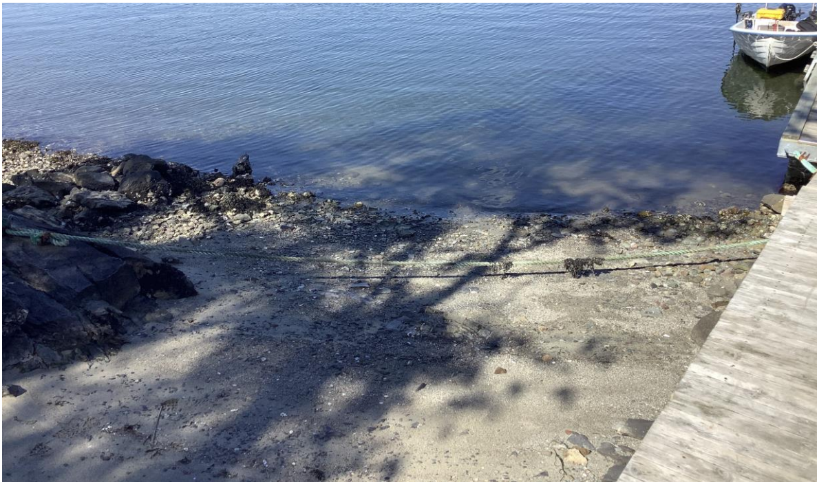
Figur 4. Bildet viser badeplassen inntil flytebrygga. Her er det lagt ut ca. 6 m 3 sand. Utleggingen på stranda ble gjennomført med manuelle redskaper.

Fucus spiralis , blæretang F. vesiculosus , stillehavsøsters Crassostrea gigas (SE), store bestander langs strandkanten og mest utenfor sandfeltet, blåskjell Mytilus edulis , nettsnegl Nassarius incrassatus , storstrandsnegl Littorina littorea og saueskjell Cerastoderma edule . Steinene i fjæra var bevoskt med kalkrørsormer (Serpulidae) og fjærerur Semibalanus balanoides . Det var ingen synlig forskjell på artssammensetningen fra stranda der det var påført sand og strandarealene lenger bort.