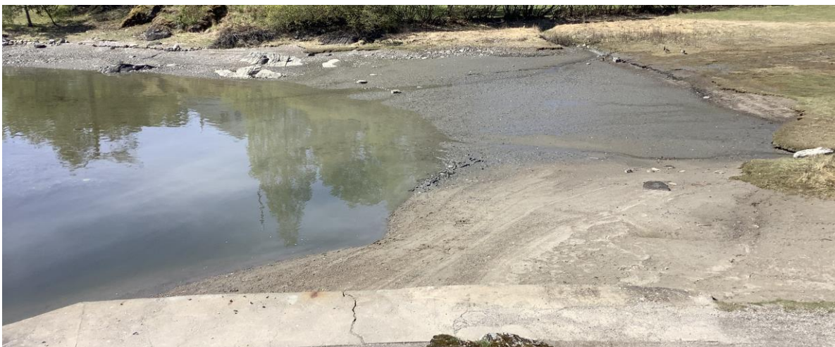
Figur 9. Området hvor det er lagt ut sand ligger på nordøstsiden av vika. Noe sand ligger utover i fjæresonen, men bunnen går snart over i blåleire og til dels kvikkleire.