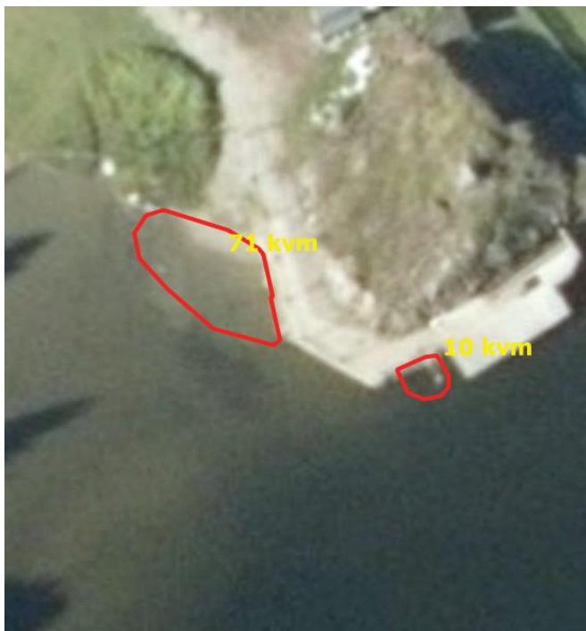
Figur 8. Badeplassen Storeslott (Gnr/bnr 41/187) ligger i Langårsundet, ca. 400 m sørvest for Middagsbukta. Den består av ei ca. 12 m brei strand samt ei badetrapp fra brygga.

stillehavsøsters (få individer), blåskjell, storstrandsnegl, saueskjell, kamskjell (Pectenidae, bare fragmenter i fjæra), sandskjell (NT) både levende muslinger og skall etter døde eksemplarer fantes.